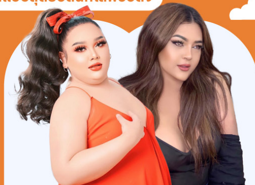
แอเคลร์ จื่อปาก / เอ็ก ชาลิสา 12 มิ.ย. 67