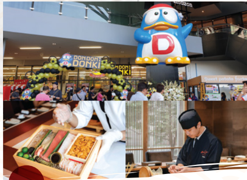
แหล่งรวมไลฟ์สไตล์