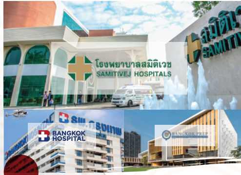
มีโรงพยาบาลคุณภาพดี