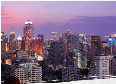
ความสะดวกสบายในการเดินทาง

"ทงหล่อ" ถนนสายสำคัญทางด้านเศรษฐกิจของกรุงเทพฯ เป็นย่านทำเลที่สามารถดึงดูดการลงทุนมหาศาลจากนักธุรกิจชาวไทยและชาวต่างชาติ พร้อมสร้างปรากฏการณ์การเติบโตสูงชันอย่างต่อเนื่อง ในแง่ของการอยู่อาศัยของชาวต่างชาติ คงไม่มีใครปฏิเสธได้ว่าทงหล่อคือย่านที่เพียบพร้อมอุดมสมบูรณ์ เป็นแหล่งการกินที่รายล้อมด้วยร้านอาหารระดับหรู และรายล้อมด้วยแหล่งที่อยู่อาศัยระดับหรูของประเทศ เป็นศูนย์รวมแหล่งไลฟ์สไตล์ของมหานครกรุงเทพฯ นอกจากนี้ยังมีมหาเศรษฐีจำนวนมากเลือกเก็บที่ดินบนทงหล่อจนแทบไม่เหลือแล้วในปัจจุบัน