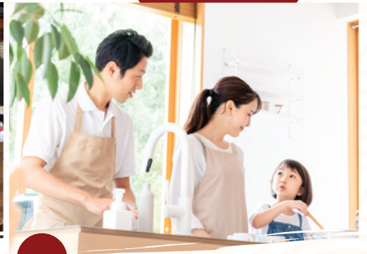
เป็นโซนที่มีความปลอดภัยสูง